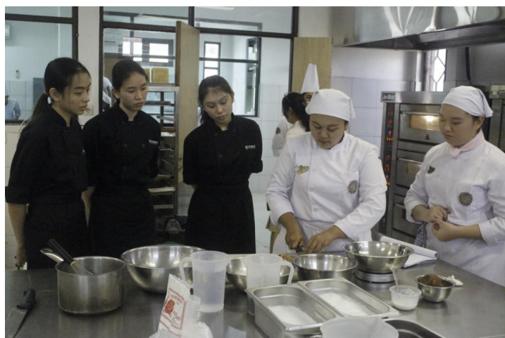
Mahasiswa poltekpar Bali menjelaskan teknik memasak kepada mahasiswa RP Singapore