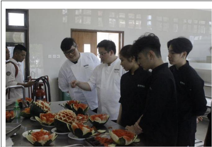
Kelas fruit carving